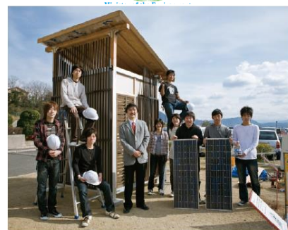
自作教材等を用いた地球温暖化防止