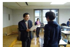
修了証を授与される受講者

なお以下に、試験に合格した本セミナーの昨年の受講者が学校や地域での環境教育に活躍し、「環境教育