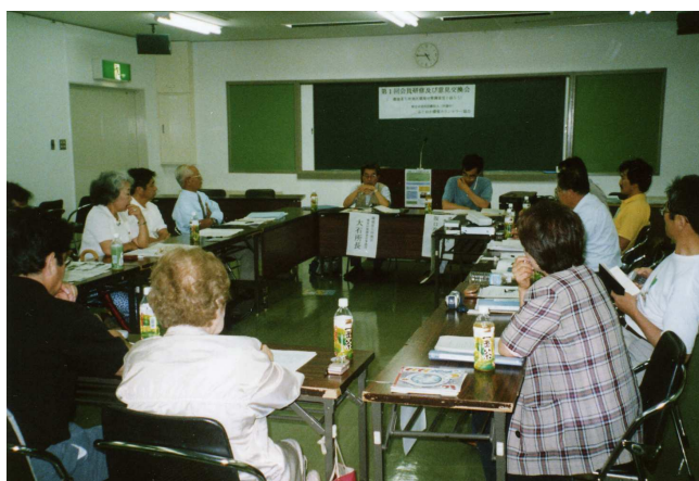
第1回研修会・意見交換会（平成15年6月28日 福岡市早良市民センター）

また、カウンセラー全員が毎年2月末までに環境省に提出する「環境カウンセラー活動実績等報告書」の研修の履歴、研さん活動の実績及び今後の活動計画に該当する協会主催の事業実績を、1月中旬にお知らせします。