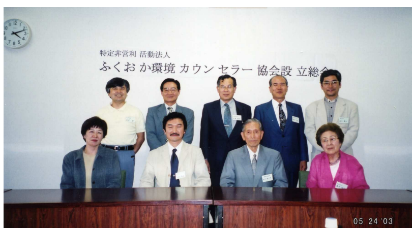
設立総会（平成 15 年 5 月 24 日 福岡市中央市民センター）

その後、福岡県庁、法務局、県税事務所などへの諸手続を行い、平成 15 年 9 月 25 日付で登記され、「特定非営利活動法人ふくおか環境カウンセラー協会」として活動を開始しました。